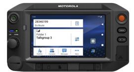
TETRA Mobilfunkgerät MXM7000 2