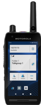
TETRA Handfunkgerät MXP7000 2